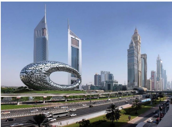
Bild 2: Affan Innovative Structures fertigt die Fassade des Museum of the Future, das derzeit in Dubai gebaut wird. Die Fassade wird aus faserverstärktem Edelstahl hergestellt.