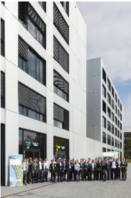
Picture 4: 25 Unternehmen beteiligten sich an der AZL-Studie „Neue Potenziale für Verbundtechnologien in Bau- und Infrastrukturmärkten“, die 2016 startete und im September 2017 abgeschlossen wurde.