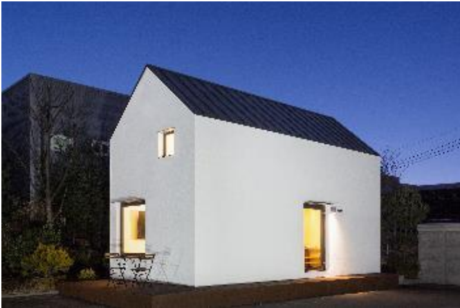
Bild 3: Pixel Haus® ist AXIA's neue Konstruktionslösung für den Bau von Häusern aus Sandwichpaneelen. Aufgrund des geringen Gewichts und der Größe ist es möglich, die Konstruktion durch einfache Montage der Paneele in weniger als einer Woche fertig zu stellen und dabei die gleiche Struktur- und Verarbeitungsleistung wie bei herkömmlichen Bauweisen zu erzielen.