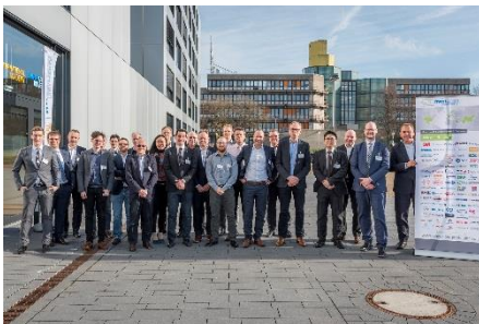
Bild 1: Vertreter von 19 Firmen nahmen an dem Kick-Off der 8-monatigen internationale Markt- und Technologiestudie „Energiespeichersysteme“ teil, die Märkte, Technologie, Zulieferkette und Geschäftsmodelle in einem dreistufigen Verlauf adressiert.

https://azl-aachen-gmbh.de/wp-content/uploads/2018/02/3_Pictures_Kick-Off-ESS.zip